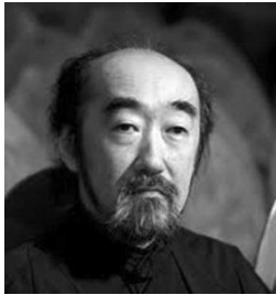
野平一郎 (ののだいら・いちろう)

1953年生。東京藝術大学、同大学院修士課程作曲科を修了後、フランス政府給費留学生として、パリ国立高等音楽院で作曲とピアノ伴奏法を学ぶ。ピアニストとしてフランス国営放送フィリハーモニック、バーゼル放送響、アンサンブル・アンテルコンテンポランタン、ロンドン・シンフォニエッタなど内外のオーケストラにソリストとして出演する一方、多くの名手たちと共演し室内楽奏者としても活躍。作曲家としてはフランス文化省、IRCAMからの委嘱作品を含む80曲以上に及ぶ作品を発表。近年ではシュレスヴィヒ・ホルシュタイン音楽祭で初演されたオペラ「マドルガーダ」、パリの IRCAMで初演されたサクソフォンとコンピューターのための「息の道」などが作曲されている。最近では積極的に指揮活動にも取り組んでいる。第44・61回尾高賞、第35回サントリー音楽賞、第55回芸術選奨文部科学大臣賞ほかを受賞。2012年春、紫綬褒章を受章。現在、東京藝術大学 作曲科教授、静岡音楽館AOI芸術監督。